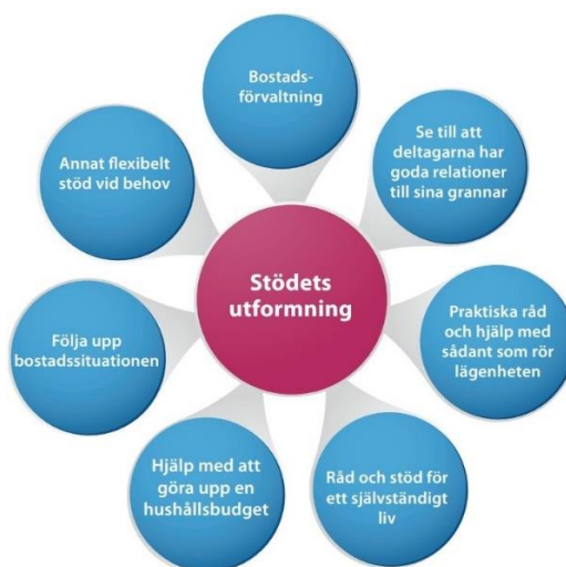
*Figur 2. Sammanfattning av hur Bostad först-personalen hjälper deltagarna att behålla sina bostäder, bland annat genom ovanstående aktiviteter som finns beskrivna i de blå bubblorna.*

Att bostaden i Bostad först beskrivs som den första viktiga delen för att uppnå en livsförändring är konstaterat. Därefter är det stödets utformning som är oerhört viktigt, inte minst för att personen som vägleds inte ska återgå till ett liv i hemlöshet eller missbruk utan att stödet i stället blir hållbart (ibid, s. 41–42). Stödet kan fungera enligt figur 2: